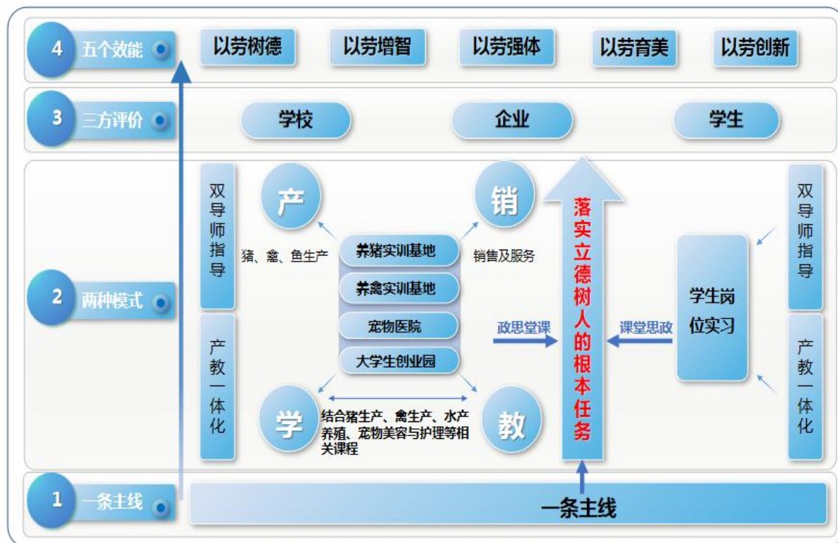
图2 畜牧兽医专业群“1234”一体化课堂革命模式图

以岗赛课证融通为抓手，创新并实施“1234”一体化课堂革命。畜牧兽医专业“1234”一体化课堂革命模式见图2。